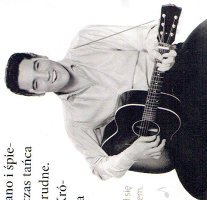
Elvis Presley (1935–1977) zajmował się nie tylko muzyką. Był także aktorem.

Nazwa rock and roll pochodzi z języka angielskiego i oznacza „kiwaj się, bujaj się i kołysz”. Wy-myślili ją w 1955 r. DJ Alan Freed [czyt.: didżej alan frijd]. W Polsce styl rockandrollowy określano jako big-beat [czyt.: big bit], czyli „mocne uderzenie”.