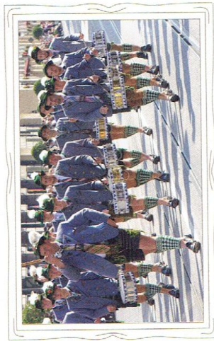
Podczas parad i korowodów organizowanych w niemieckich miastach muzycy wykonują marsze.