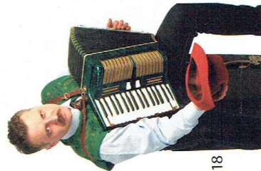
Typowym instrumentem używanym w niemieckich kapelach jest akordeon.