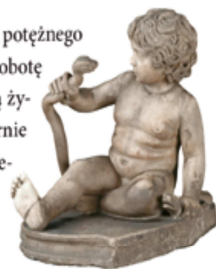
Rzymska rzeźba przedstawia małego Heraklesa walczącego z wężami.

Ów Eurysteus był wielkim tchórzem. Ujrawszy przed sobą tak potężnego silacza, zląkł się i chcąc się go pozbyć, prędko wymyślił dlań robotę dość niebezpieczną, aby mógł być pewny, że bohater przyplaci ją życiem: kazał mu [...] zabić hydrę lernejską [...]. Hydra była niezmiernie wielka i miała dziesięć głów, z których jedną, w samym środku, nie-