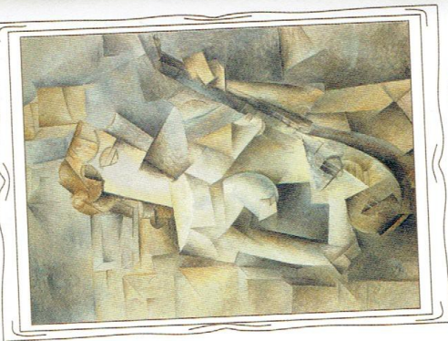
Pablo Picasso [czyt.: pikasso], Kobieta z mandoliną

Muzyczny impresjonizm zapoczątkował wiele zmian, które wpłynęły na późniejszy rozwój muzyki. W XX w. kompozytorzy poszukiwali nieznanymi dotąd brzmień, np. w utworach wokalnych wykorzystywali szept, gwizd i krzyk. Stosowali również nowe formy muzyczne.